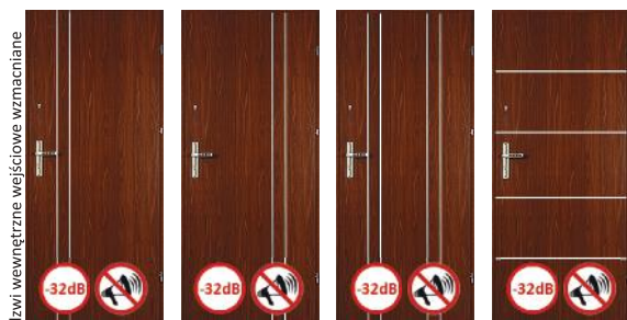
Solid Alu 1